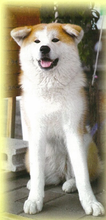
大館北秋田芸術祭 広報戦略室長「のの」